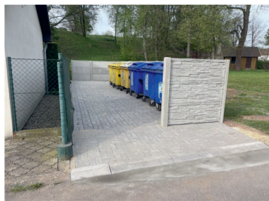
Nové kontejnerové stání v areálu Pod Skalkou