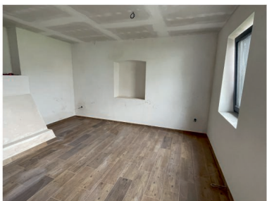
Prostor salónku vznikající hospůdky v Nové Vsi