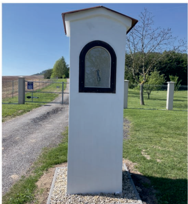
Opravená boží muka u myslivny v Nové Vsi