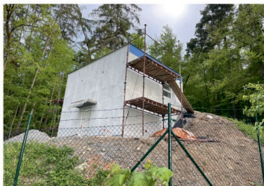
Rekonstrukce vodojemu v Nové Vsi