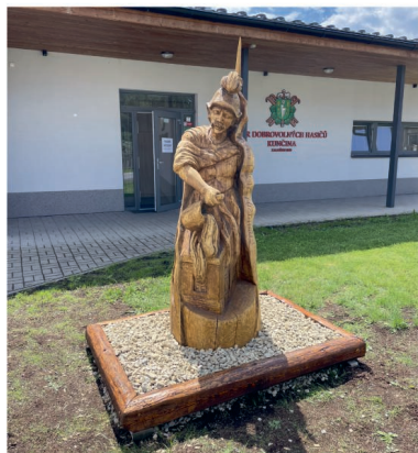
Socha svatého Floriána před budovou Hasičské zbrojnice v Kunčíně